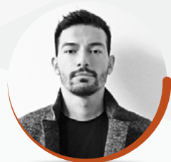
arch. TOMAS GHISELLINI Tomas Ghisellini Architetti