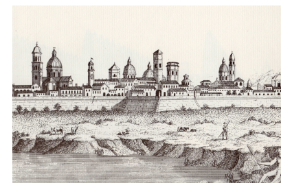
Associazione dei geometri della Provincia di Reggio Emilia

Via A. Pansa n. 1 (ingresso dal civico adiacente il parcheggio) 42124 Reggio Emilia