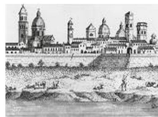
Associazione dei Geometri della Provincia di Reggio Emilia

ecOBETON PROTEZIONE TOTALE DEL CALCESTRUZZO